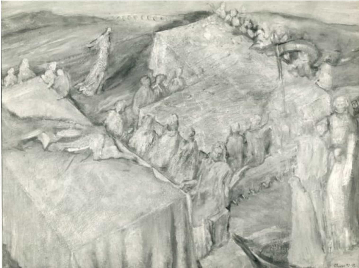
Застолье (Дань Маньяско), Акриловые краски на оргалите, 70 x 120 см, Москва, 1970-72 гг.