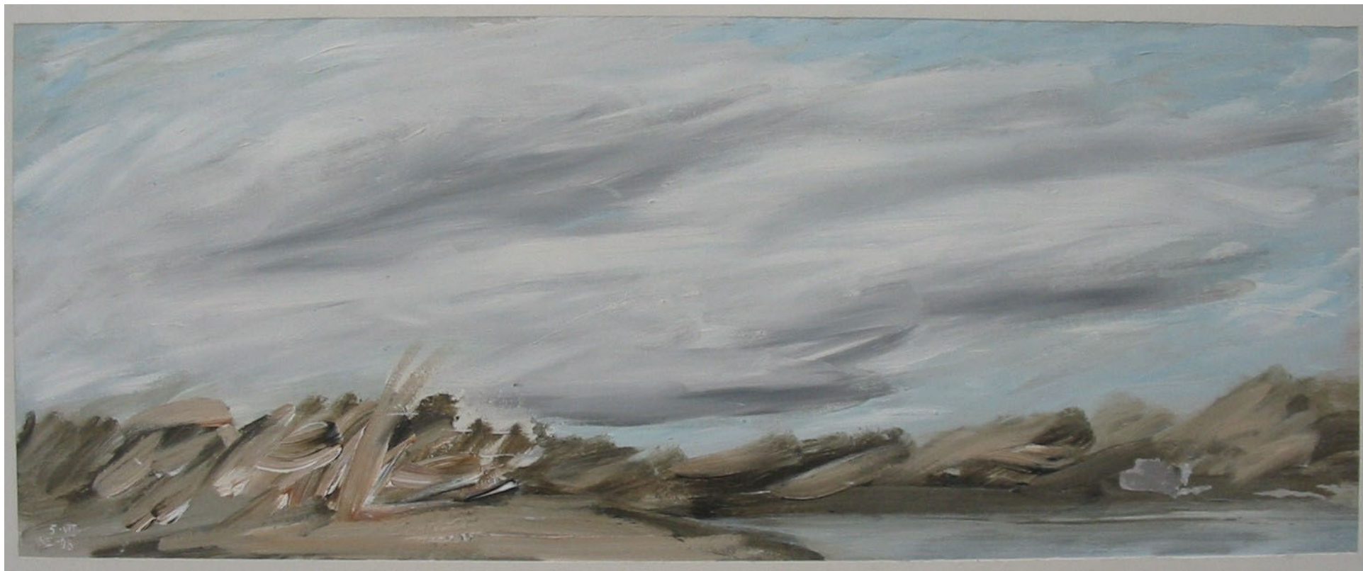
Пейзаж. Акриловые краски на картоне. 38,5 x 101 см, 1998 г., Париж