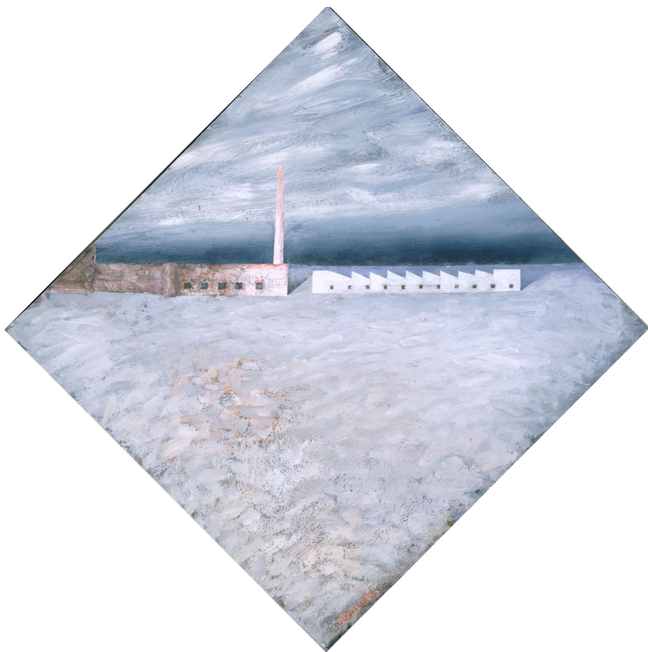
Заброшенный завод Акриловые краски на картоне 65,5 x 65,5 см, 2006 г., Париж