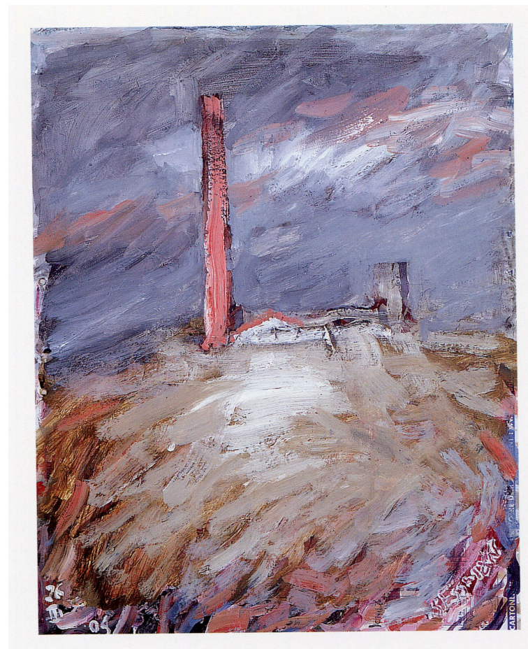
Фабрика на холме (Красная земля) Акриловые краски, акварель на картоне 55 x 43 см, 2004 г., Париж