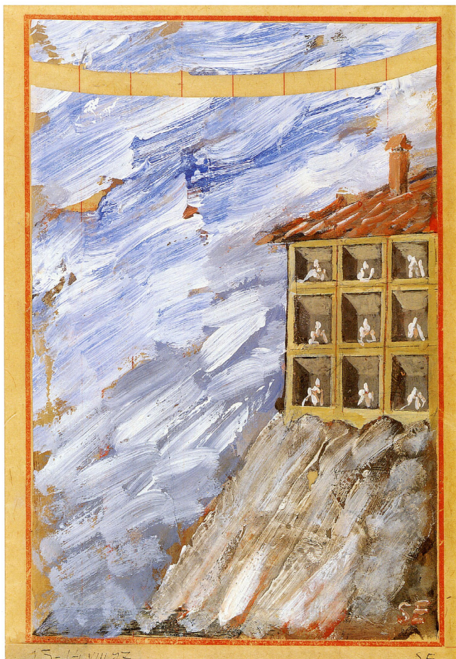
Дом на холме Акриловые краски, коллаж на китайской бумаге 28,5 x 18,3 см, 1997 г., Париж.