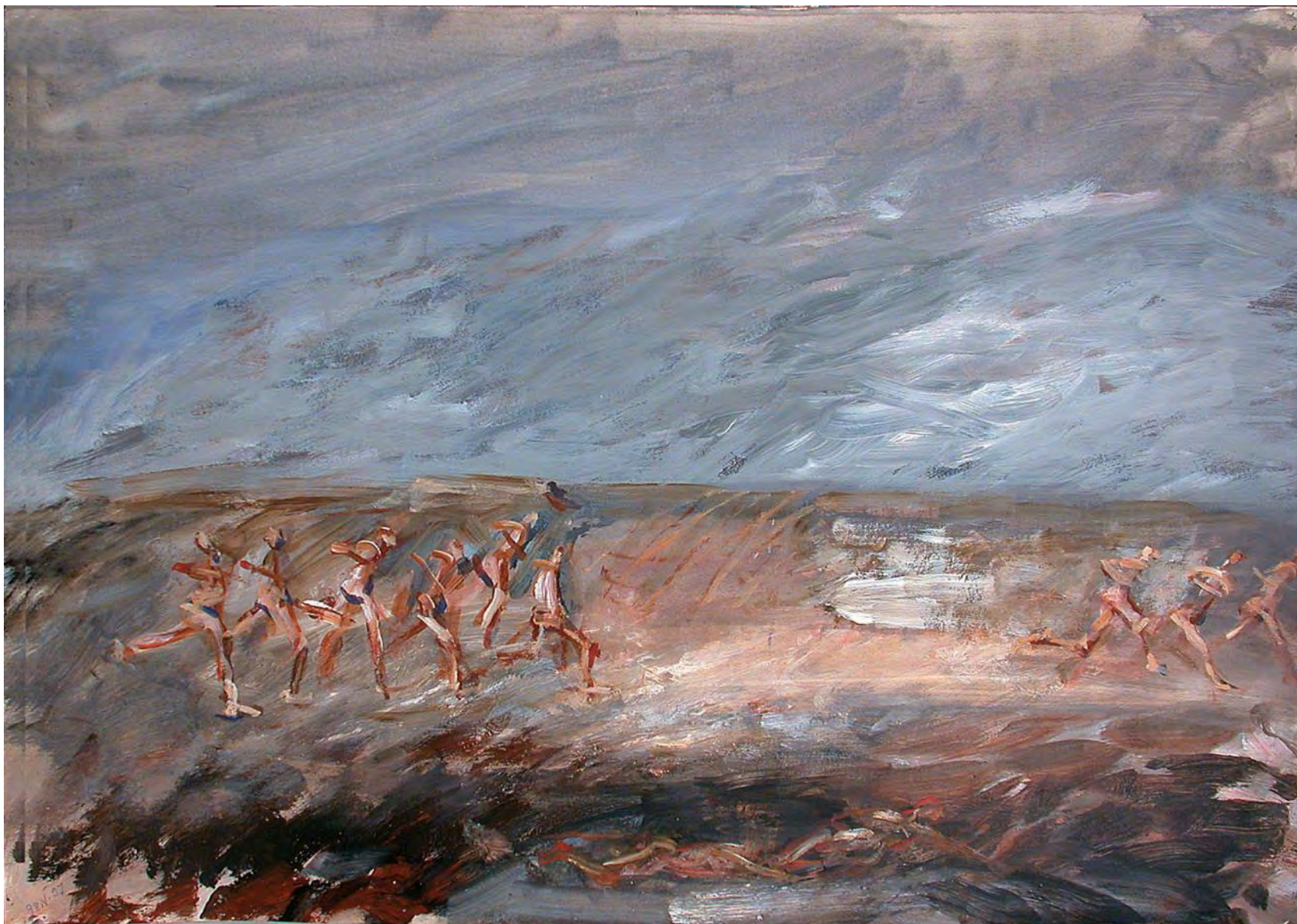
Марафон у раскопок. Акриловые краски на бумаге. 70 x 99,8 см. Париж. 1997 г.