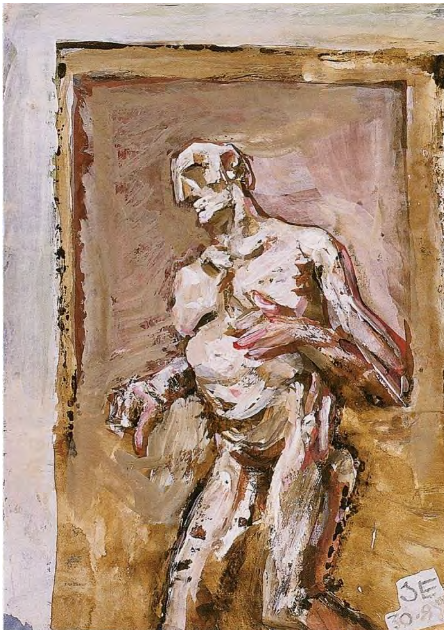
Бегун. Акриловые краски на бумаге. 20,6 x 14,7 см. Париж. 1982 г.