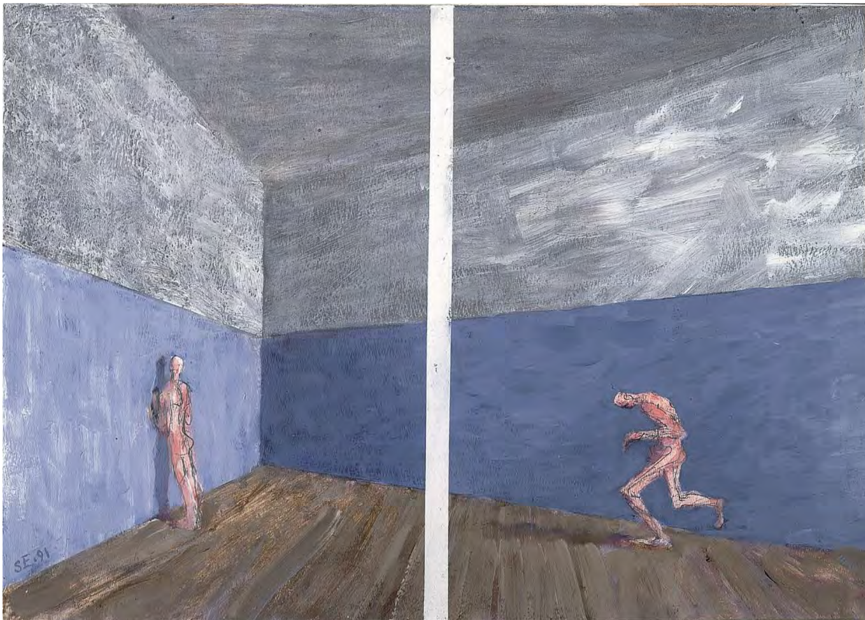
Урок физкультуры. Диптих. Карадаш, акварель и акриловые краски на бумаге. 31,7 x 44,4 см. Париж. 1991 г.