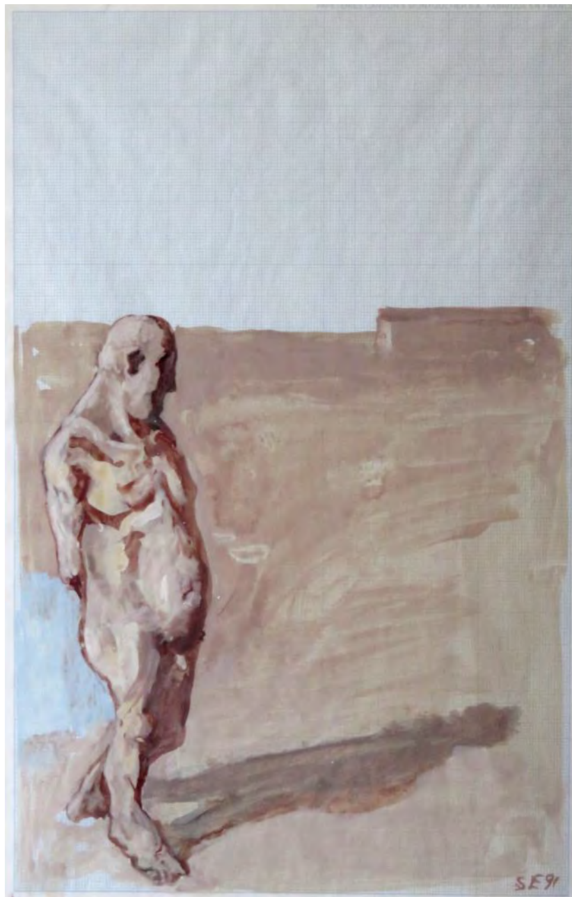
Философ. Акриловые краски на бумаге. 29,7 x 21 см. Париж. 1991 г.