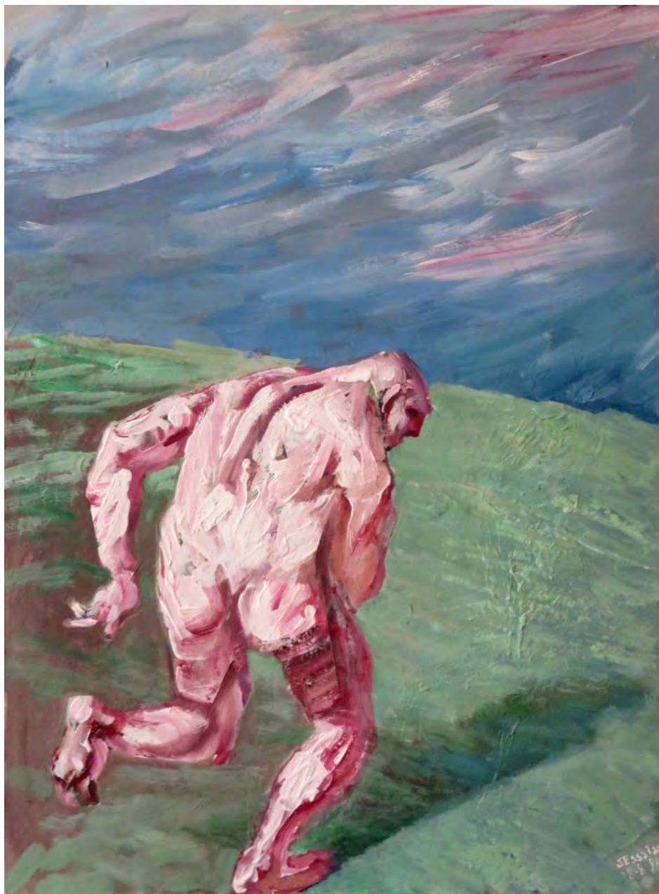
Бегун. Акриловые краски на бумаге. 68,4 x 50,8 см. Париж. 1990 г.