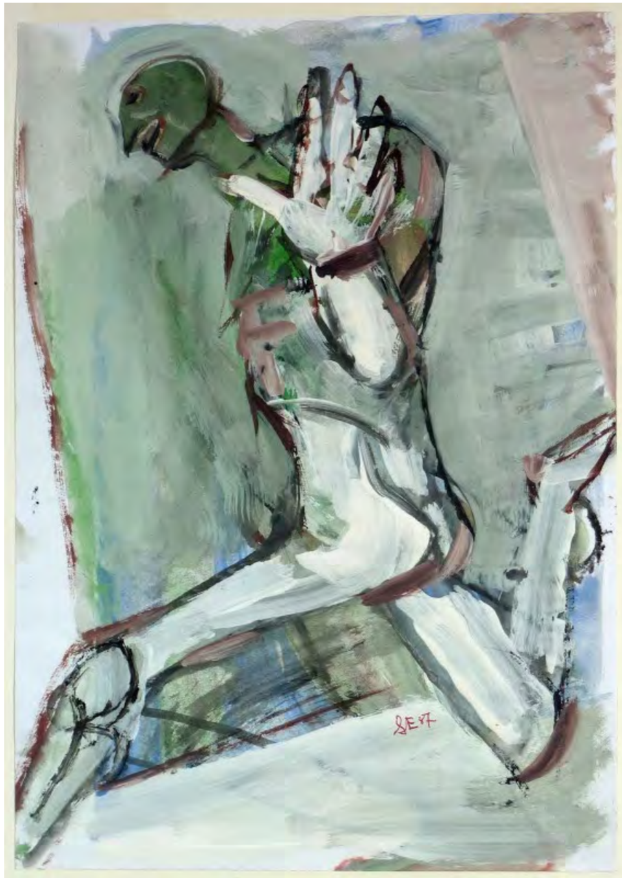
Бегун. Акриловые краски на бумаге. 29,7 x 21 см. Париж. 1991 г.