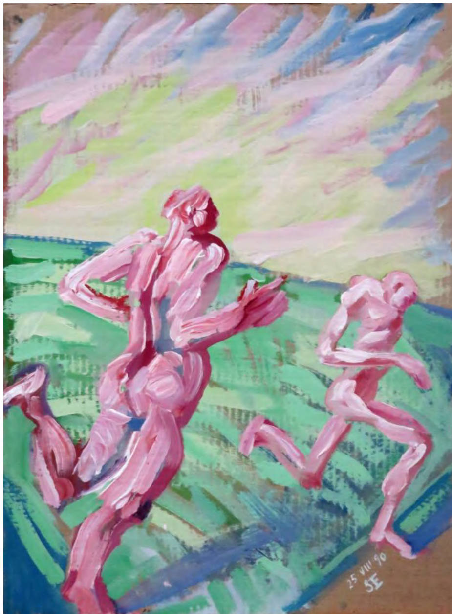
Бегуны в полях. Акриловые краски на картоне. 60 x 50,5 см. Париж. 1990 г.