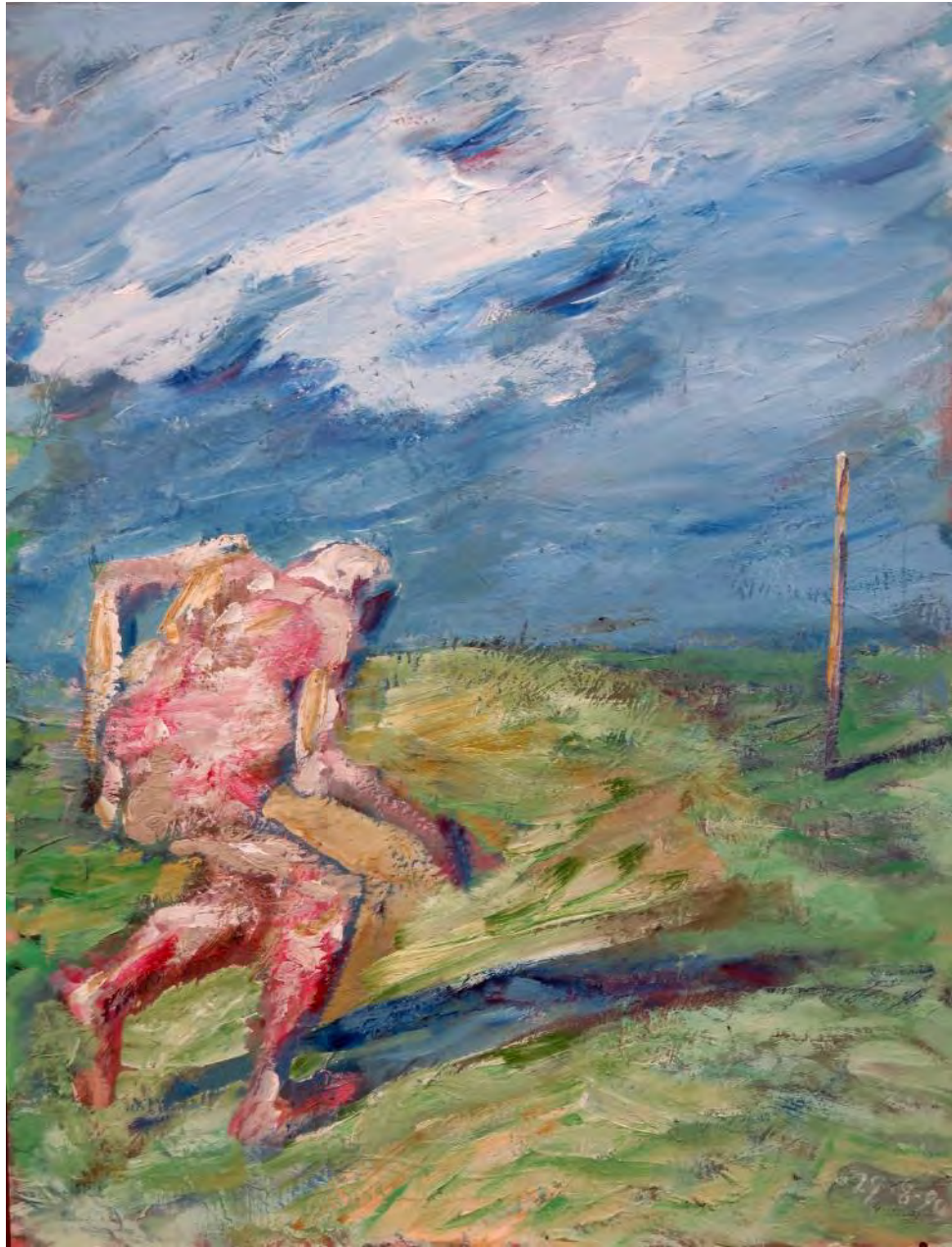
Бежен. Акриловые краски на картоне. 65 x 50 см. Париж. 1990 г.