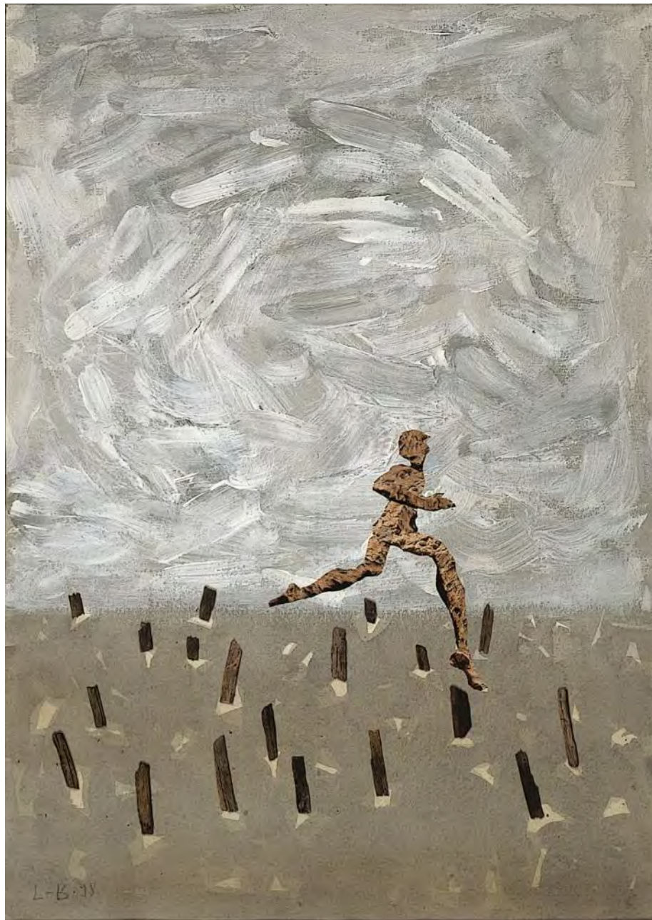
Беженец из Ламот Бёврона. Акварель, акриловые краски, коллаж на бумаге. 44,5 x 32 см. Париж. 1998 г.