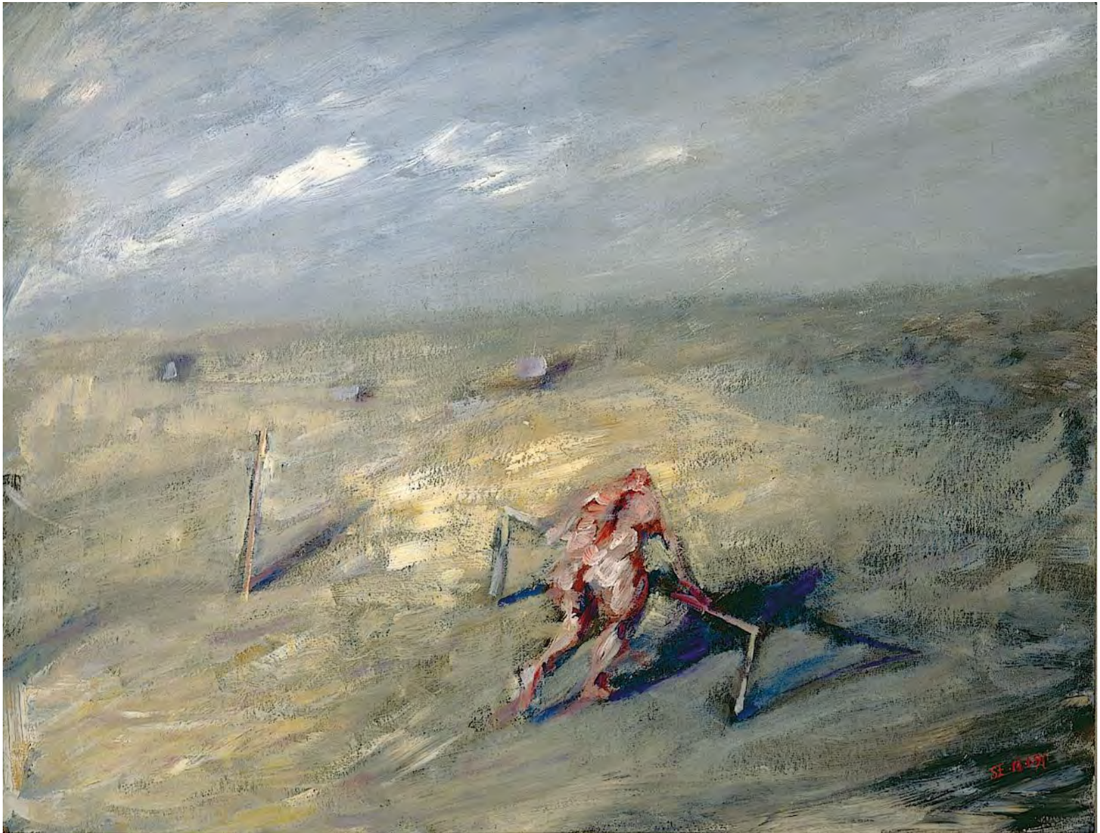
Блудный сын. Акриловые краски на картоне. 50 x 65 см. Париж. 1990 г.