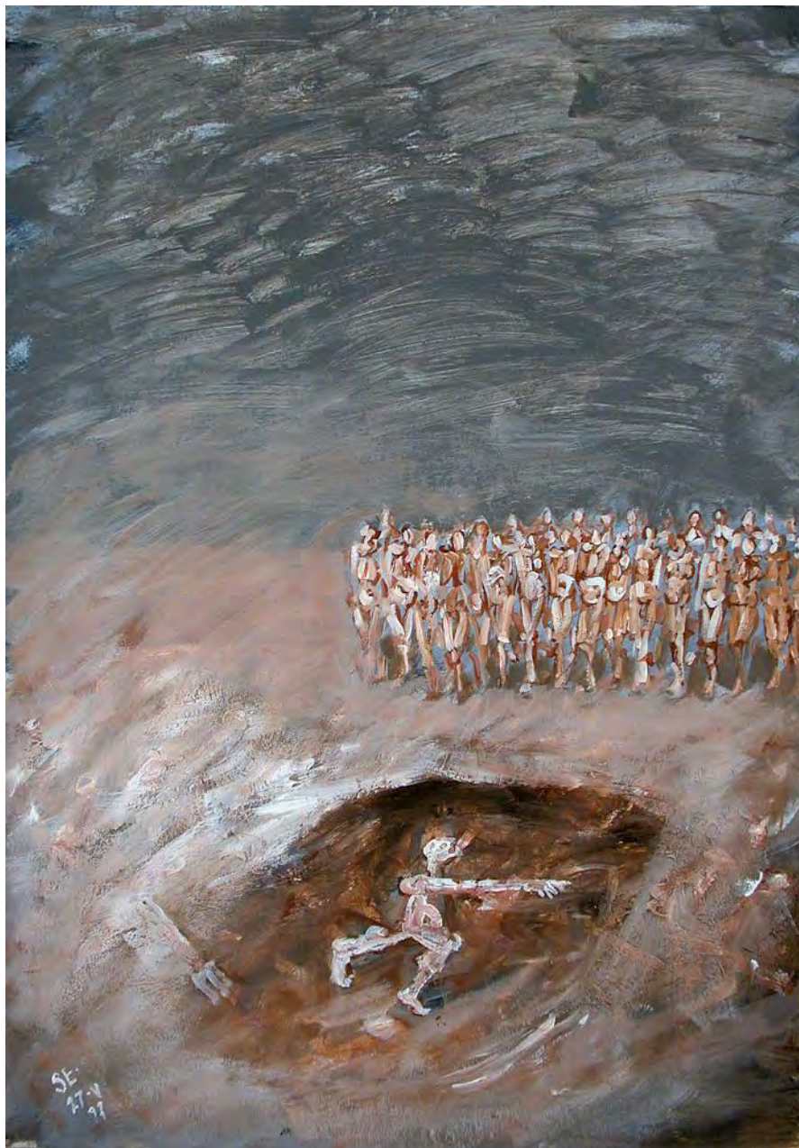
Археологи. Открытие. Акриловые краски на бумаге. 100 x 70 см. Париж. 1997 г.