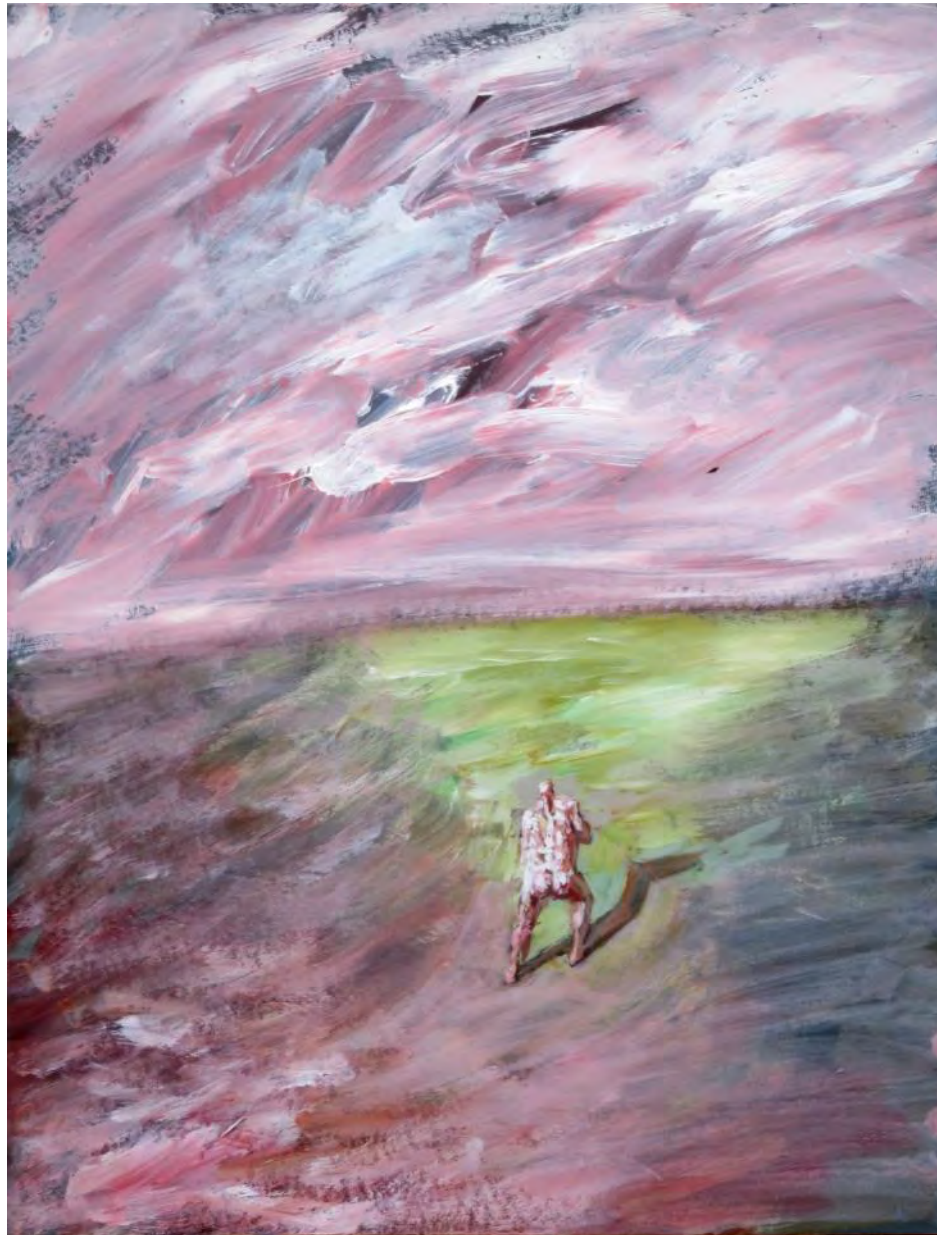
Бегун. Акриловые краски на картоне. 50 x 65 см. Париж. 1990 г.