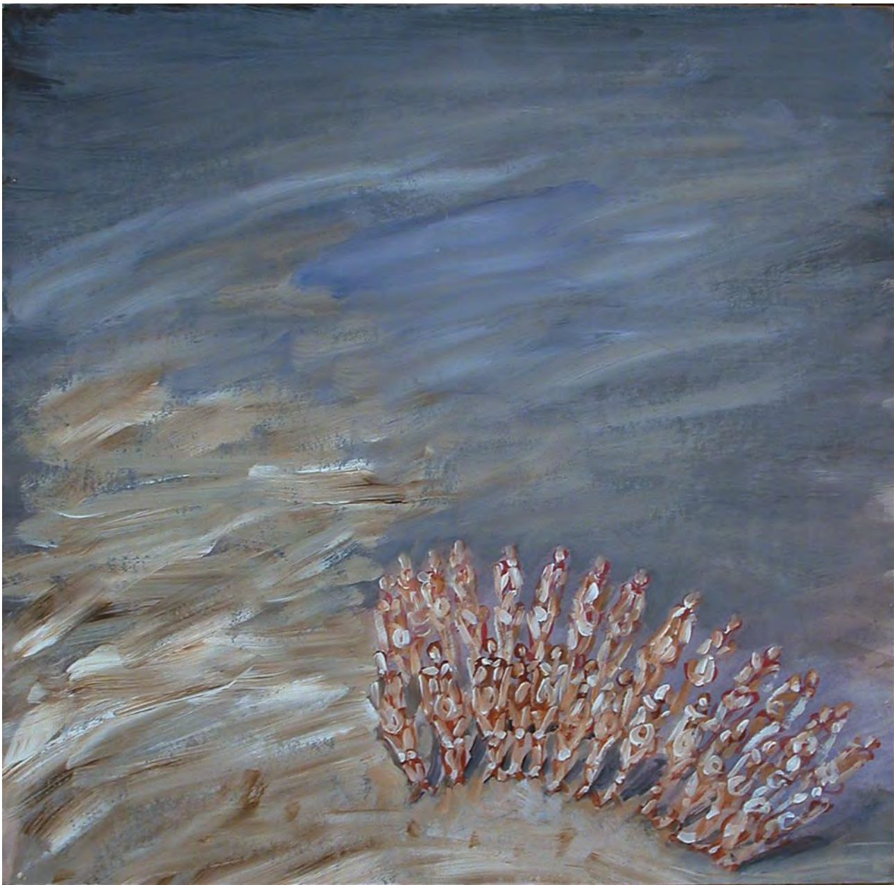
Археологи. Вид с вертолета. Акриловые краски на бумаге, наклеенной на оргалит. 70 x 70 см. Париж. 1997 г.