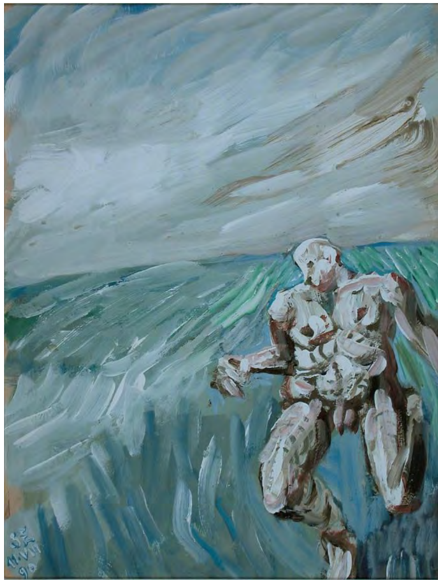
Бегуны в полях Ван Гога. Акриловые краски и акварель на картоне. 30,4 x 23 см. Париж. 1990 г.