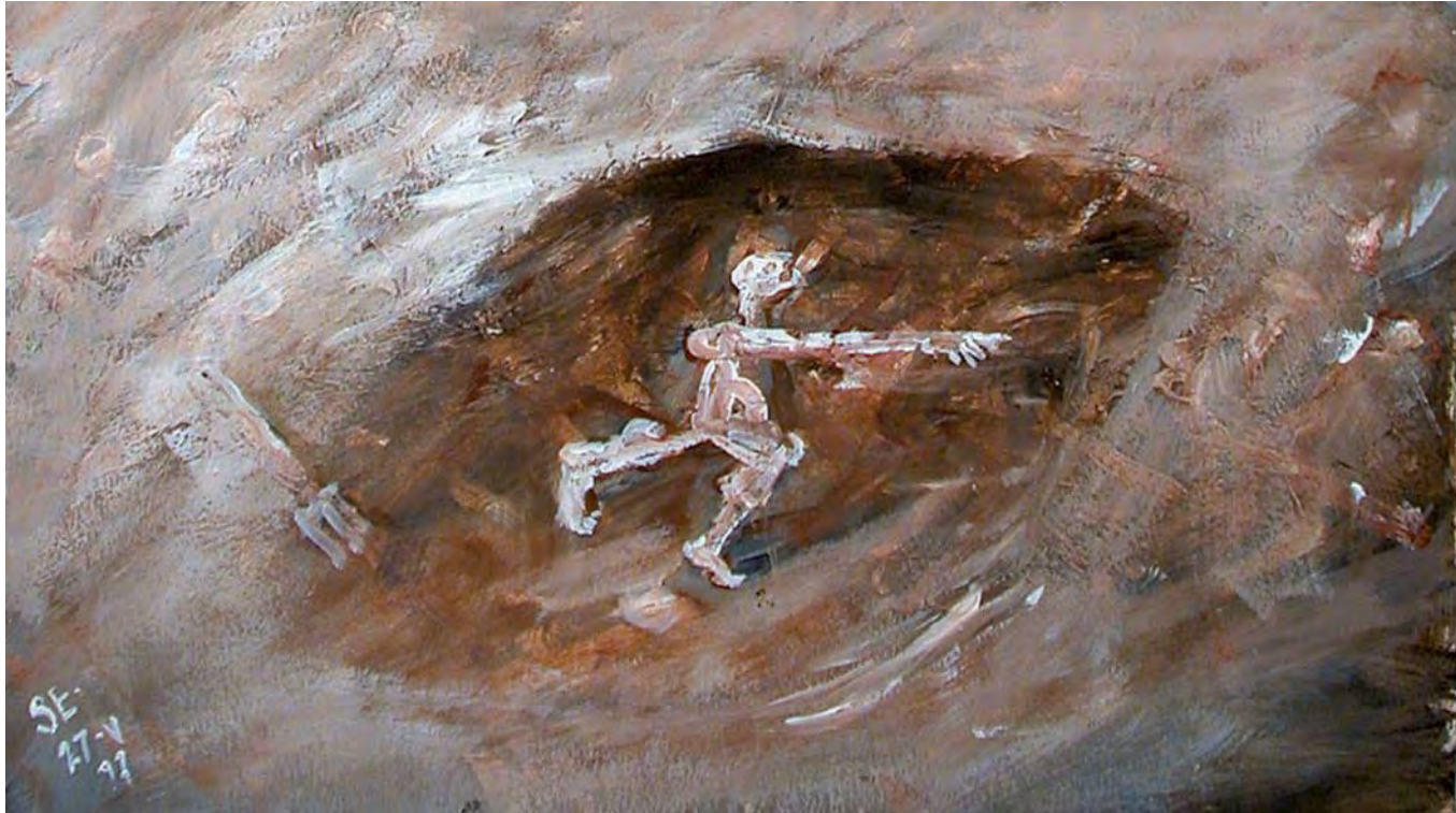
Археологи. Открытие. Фрагмент