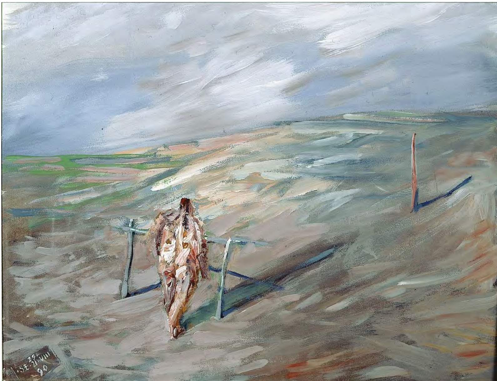
Блудный сын. Акриловые краски на картоне. 50 x 65 см. Париж. 1990 г.